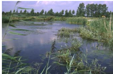
OVB-terrein nog in gebruik