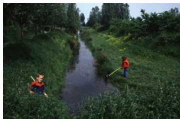
Waterbeestjes vangen in de Zump