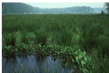
Poel in de Regulieren