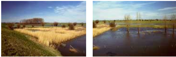
Beusichemse Waard bij Weidsteeg

De Beusichemse Waard is een grote waard. Deze loopt vanaf de Trektelpost door tot de Schaardijkse weg nabij Ravenswaaij. In het westelijk gedeelte is een ooibosje aanwezig met wilgen en populieren. Vanaf even oostelijk van de Weidsteeg tot voorbij de Veerweg Beusichem is een natuurontwikkelingsproject uitgevoerd. Daar heeft de NVWC een vogelkijkhut geplaatst. Het oostelijke gedeelte van het gebied, waar de boerderijen 'Den Oven' en 'De Duinen' zijn gelegen, bestaat uit grootschalig landbouwgebied. Het gebied is niet toegankelijk. Het is te overzien vanaf de Beusichemse Dijk en de Veerweg Beusichem.