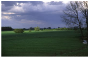
Redichemse Waard vanaf Lekdijk