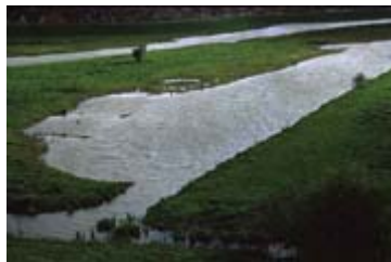
Barsemwaard vanaf uitkijkpunt