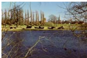
Ronde Haven

De Ronde Haven is ooit een Culemborgse Haven geweest. Door de aanleg van de spoordijk werd de verbinding met de Lek afgesloten. Het is een waterplas met een oude strang, de 'Kleine Lek', enkele weilanden en wilgenbos. Het gebied staat in contact met de Baarsemwaard. Het gebied is vrij toegankelijk.