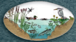
helder en diep water vol leven