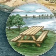
picknickplaats en zwemstrandje