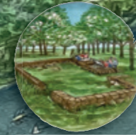
de terp met archeologie