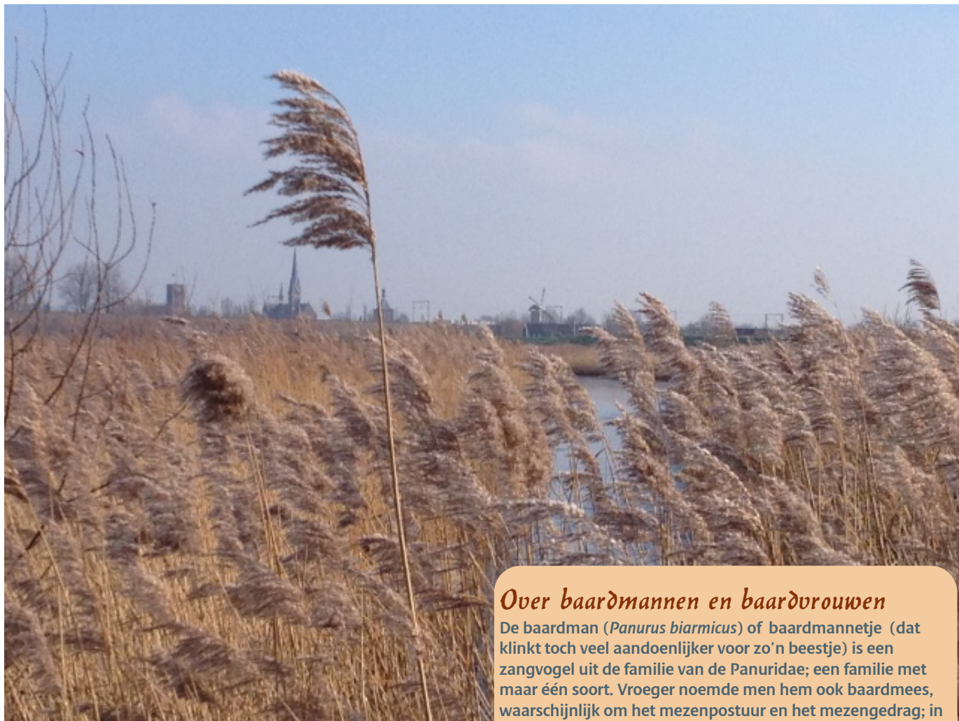
Baardmannetjes vinden volop riet in de Baarsemwaard.

ruime beschikbaarheid van oud, overstaand riet. De vogels schakelen na de broedtijd over van een insectenmenu op rietzaden, en dat is tegenwoordig in redelijke overvloed aanwezig in de uiterwaarden in onze omgeving waar nieuwe natuur is ontwikkeld. De overwinteringsomstandigheden in met name de Baarsemwaard zijn blijkbaar ook uitstekend voor andere riet- en moerasvogels getuige de territoria van meerdere waterrallen (tot wel 5 exemplaren tegelijk!), die dit duidelijk maken met volop gekip, geknor en gekrijs. Ook de roerdomp kan met wat geluk de hele winter door tussen het overjarige riet langs een strang ontdekt worden. Ondanks de grote aantallen wandelaars en hondenuitlaters is de combinatie van rietruigten en -moeras, strangen met begroeide oevers en wilgenopslag ook 's zomers een eldorado voor meerdere riet- en moerasvogels: blauwborst, rietzanger, sprinkhaanzanger, kleine karekiet, grasmus, rietgors, waterral en bruine kiekendief, en dan heb ik nog maar een deel opgenoemd. Hoe aantrekkelijk blijkt ook uit de klappers van het afgelopen jaar: woudaap, kwak en Cetti's zanger (lees Hak-al 2014 nr.1 er maar op na).