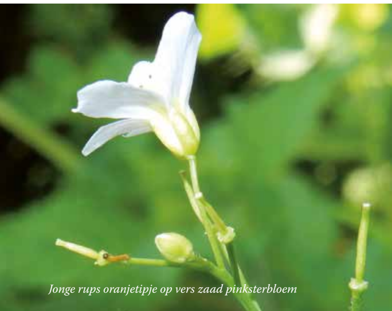
Jonge rups oranjetipje op vers zaad pinksterbloem

bloemen en bloemknoppen gevonden zonder andere eitjes, dan zet ze er één eitje af. Dan hoeft ze er nog maar 99 ... Logisch dat ze zo effectief met haar tijd wil omgaan.