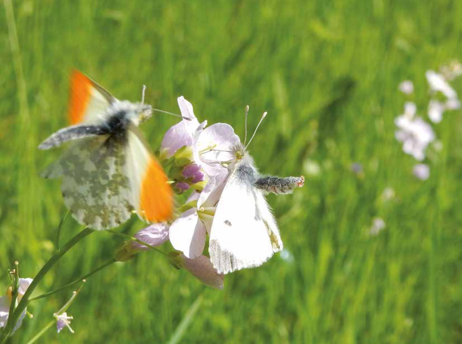
Oranjetipje vrouw wijst man af