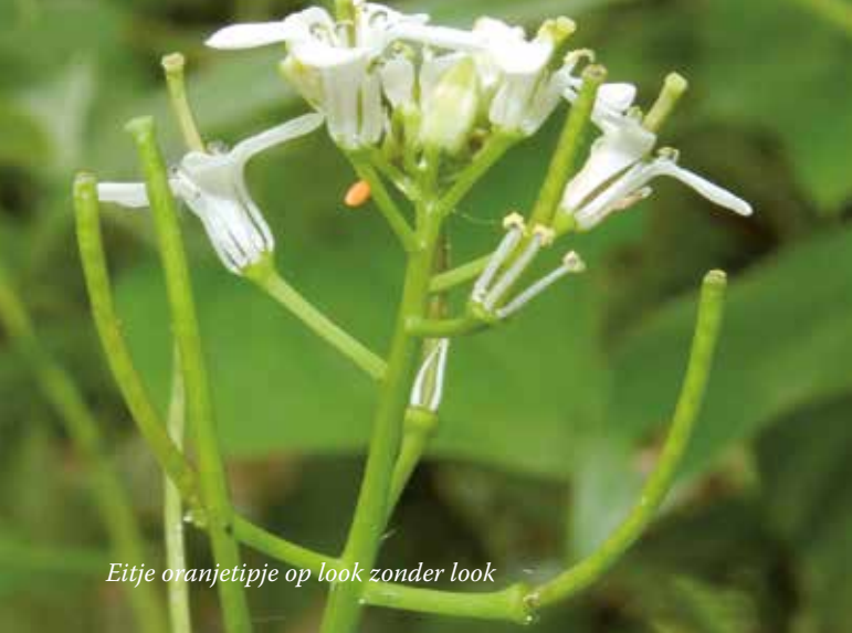
Eitje oranjetipje op look zonder look