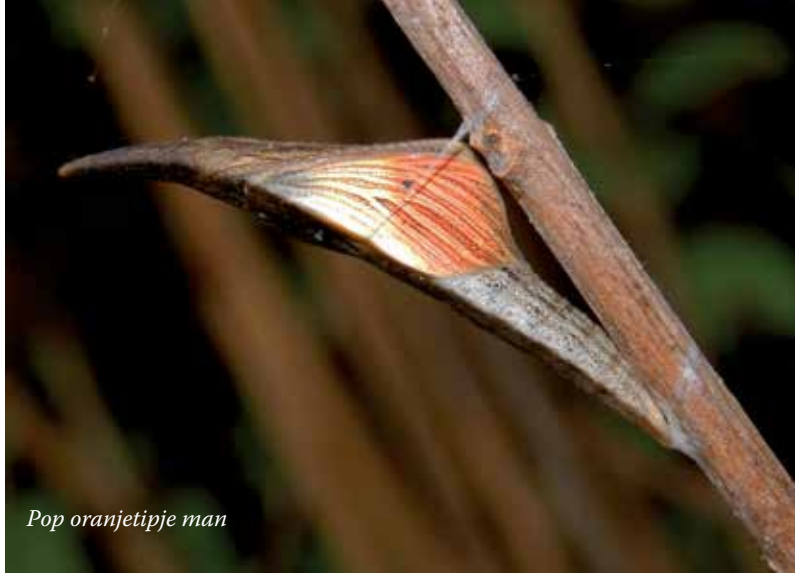
Pop oranjetipje man