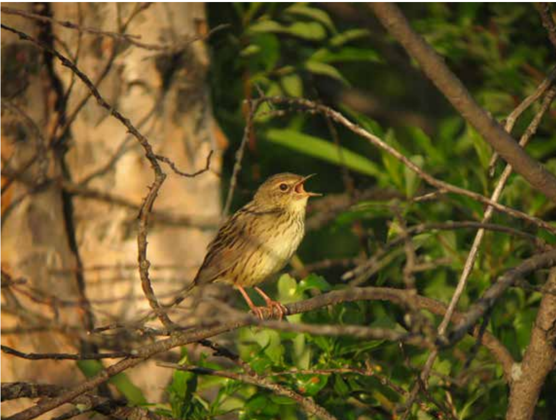
Kleine sprinkhaanzanger. Rob Felix

maar dan met de baard in de keel en zoals Louis treffend zei, "Het lijkt wel een machientje." "Het lijkt wel een kleine sprinkhaanzanger!" riep ik vervolgens uit, een soort uit Oost-Azië die in juni net Finland bereikt en in het najaar heel af en toe in Noord-West Europa wordt gezien. "Ja!", riep Louis die deze soort in zijn broedgebied in zuidelijk Siberië heeft gezien en gehoord. We begonnen beiden met het opnemen van de zang terwijl de adrenaline door de aderen gutste, in gedachten malend over wat het kon zijn. Alsof dat nog niet genoeg was, meldde Berry Lucas een kleinst waterhoen op de Pavijen, nog een nieuwe soort voor het werkgebied! Wat moesten we doen? De Big Day staken? Anderen informeren? We wisten het allesbehalve zeker, het kwartje wilde maar niet vallen, de vogel staakte haar zang en er begon een sprinkhaanzanger even verderop te zingen. Zou het een afwijkende vogel zijn? We besloten de vogel te parkeren, en gingen tevergeefs op zoek naar matkopmezen. De rest van de dag fietsten we rond met de vogel in ons achterhoofd.