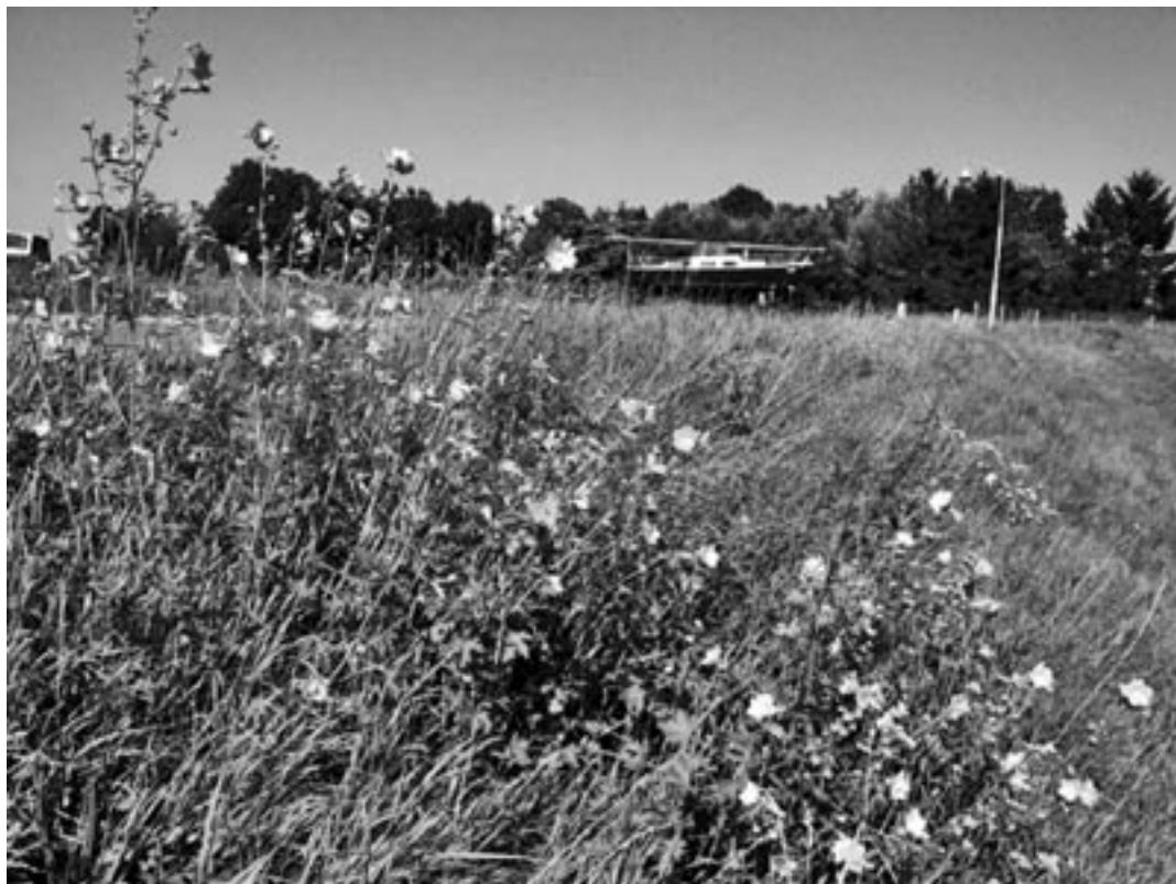
Vijfdelig kaasjeskruid (Culemborg).