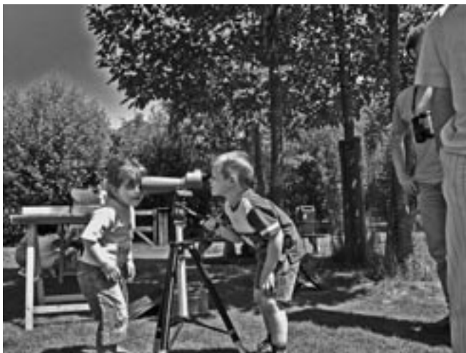
"Leren" kijken door een telescoop tijdens de thema dag Vogels.

De vogelwerkgroep was ook aanwezig op twee themamiddagen van het steunpunt NME. Op 26 juni was het thema "Verandering". Deze activiteit werd door de NVWC en het steunpunt NME samen georganiseerd vanwege het 30-jarig bestaan van de NVWC. Vooral onder kinderen van circa 10-15 jaar was er veel animo om door de verrekijkers en telescoop te kijken. Op 13 november was het thema "Vogels". Valkenier Bruce Colle gaf een show met zijn woestijnbuizerd. De vogel vloog een rondje over het erf, speurde het terrein af op mogelijke prooien en kwam, gelokt door een stukje vlees, weer op de arm van Bruce zitten. Een klein kipje dat de ophokplicht ontvlucht was, is daarbij niet aan de aandacht van de woestijnbuizerd ontsnapt....en is gegrepen. Op de activiteit zijn wel 1600 bezoekers afgekomen en vele kinderen hebben een spectaculaire ervaring opgedaan: een woestijnbuizerd op hun arm.