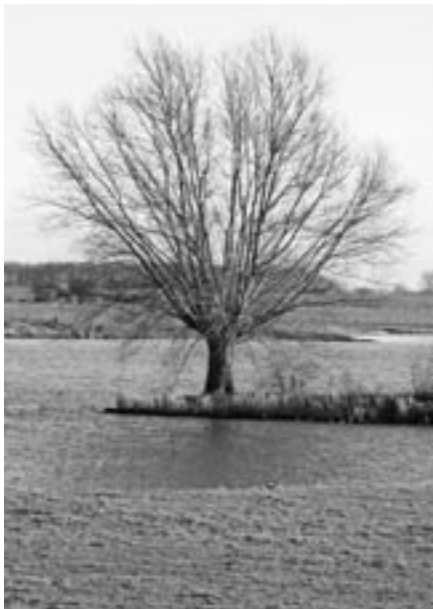
Knotwilg bij de trektelpost.

De twee snoeidagen op De Duinen te Beusichem moesten onverwacht worden geannuleerd. In voorgaande seizoenen kregen wij altijd ontheffing van de gemeente Buren om het resthout te verbranden. Plotseling kregen wij deze niet meer en omdat een andere verwerkingsmogelijkheid niet mogelijk was moesten de dagen worden geannuleerd op deze locatie. Wij zijn in gesprek gegaan met de gemeente Buren en dit verliep nogal stroef (op ambtelijk niveau) Pas na een gesprek