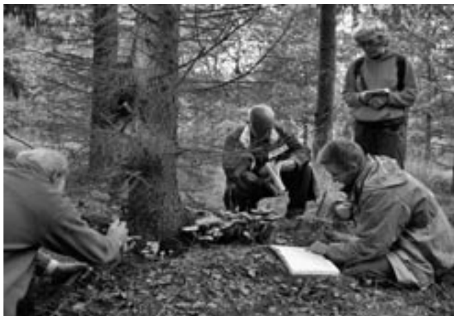
De paddenstoelen worden als het even kan direct in het veld gedetermineerd, Kaapse Bossen.