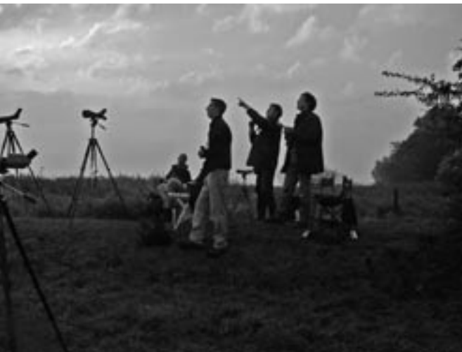
Een geliefde bezigheid, trektellen.

Wat voor een groepje vogelaars uit Utrecht in 2004 begon als een kleinschalig hobbyproject- het volgen van enkele slaapplaatsen in de omgeving van Mijdrecht - is uitgegroeid tot een min of meer landelijke telling waaraan ook de vogelwerkgroep heeft deelgenomen. Het doel van de telling