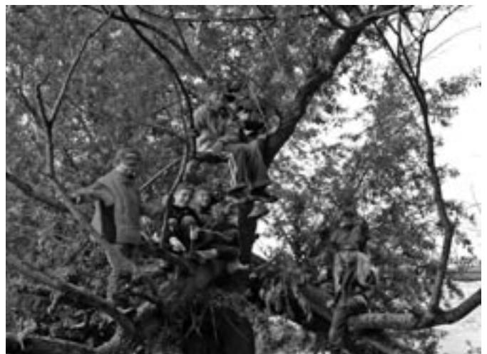
The Green Rangers Culemborg.