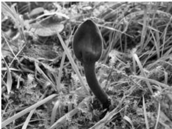
Een spectaculaire nieuwe aanwinst voor de paddestoelenflora van het Tichelterrein te Buren: de ruige aardtong.

Er werden twee excursies gehouden. Op zaterdag 25 juni leidde Henk Vennix een groep rond in de Moerputten bij 's-Hertogenbosch. We genoten van de grote ratelaar, de