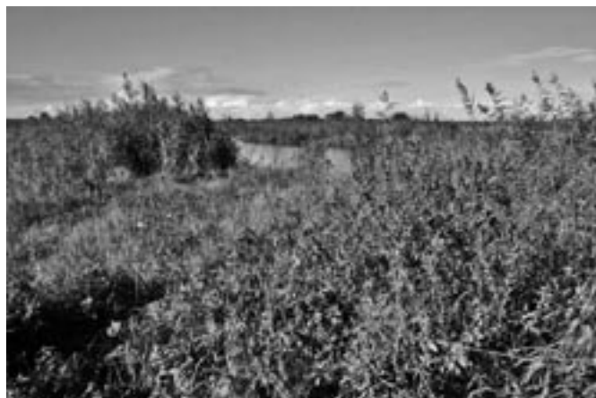
De Baarsemwaardstrang als leefgebied voor de houtpantserjuffer.

In 2005 zijn libellenroutes gelopen in de Zump, de Regulieren en de Baarsemwaard. De libellenpopulaties in de Zump