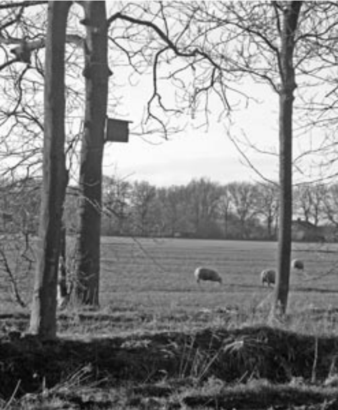
Bosuilenkast in het Rondeel.

Wat de activiteiten van de vogelwerkgroep in 2005 waren, lees je in onderstaand verslag. De activiteiten lopen uiteen van het geven van cursussen tot roofvogeltellingen, het doen van onderzoek naar broedvogels tot gezellig samen vogels kijken en het maken en plaatsen van nestkasten. De nestkastenwerkgroep en vogelwerkgroep zijn samengevoegd en daarmee hebben we nu ongeveer twintig actieve leden.