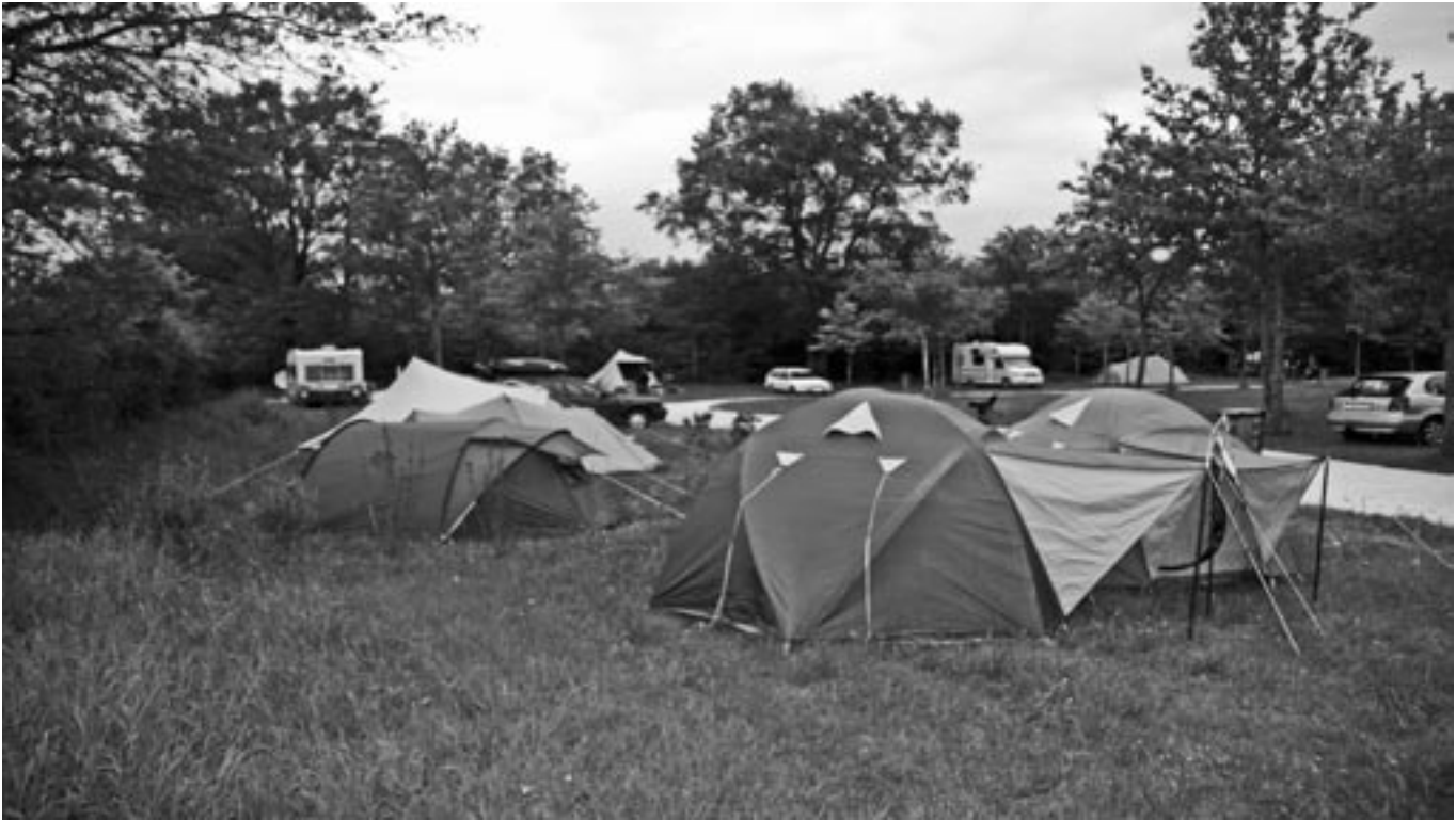
Hemelvaartkamp La Brenne.

op 29 oktober naar de Kaapse Bossen. Paddenstoelen zorgen elk jaar weer voor verrassingen. Dit jaar waren hele stukken bosgrond paars gekleurd van de duizenden rodekoolzwammen. Er is een verslag toegezegd dat in 2006 in de Hak-al zal verschijnen. Daarnaast ging de plantenwerkgroep op stap in de EVA-wijk om de wilde flora te inventariseren die zich met name in en rond de vijvers uitbundig ontwikkelt. Een verslag van deze inventarisatie zal in 2006 in de Hak-al verschijnen.