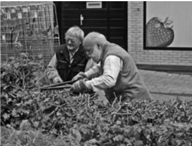
Een groot deel van de haag is verlaagd.

De werkzaamheden van de K&T-groep starten steeds met het rommelvrij maken van de tuin rondom de Ketelvink. En vergis u niet over wat er binnen een week zoal in zo'n tuin gedumpt wordt. Kassabonnen van de Coöp en de Plus liggen er altijd en overal, lege blikjes en flessen, plastic zakken en zakjes (chips), binddraad van te verspreiden folders en soms ook de hele pakken folders, wasbakken en toiletpoten, oude fietsen of delen ervan, puin, kleding (met hele zakken uit de kledingcontainers gehaald en daarna weer over het hek op de composthoop gedumpt). Het is wekelijks weer een verrassing wat we tegenkomen. Afgelopen jaar stonden er zelfs twee bromscooters in de tuin. Verstopt tussen het groen om later te worden opgehaald. Helaas voor de dieven werden ze eerder door ons ontdekt dan dat ze konden worden verpatst. Eén exemplaar stond al geregistreerd als gestolen, de andere nog niet. Beide scooters zijn door de politie opgehaald.