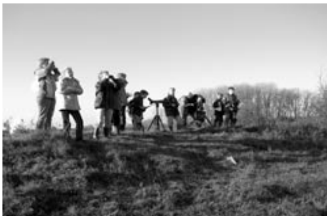
Ganzen kijken.

Als u nog ideeën of thema's heeft voor de activiteiten van de Green Rangers dan horen we die graag!!