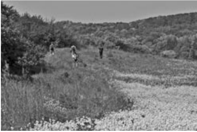
Excursie Pietersberg.