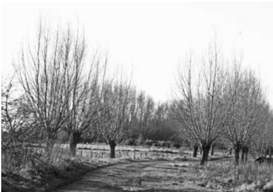
Knotwilgen lang de afgraving (Culemborg).