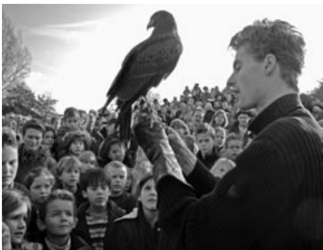
Woestijnbuizerd met zijn Bruce Colle.