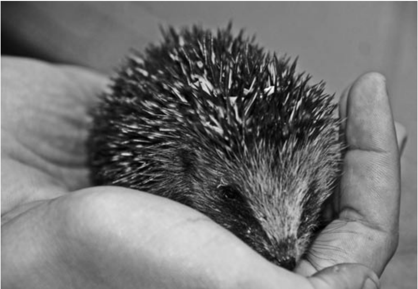
Hans in de hand. Het woog bij binnenkomst 109 gram.

Onderstaand de groeicurve van Hans. Op 24 september is Hans in de Plantage uitgezet.