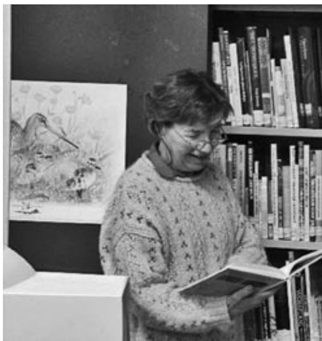
Overzichtelijk blijft van het werk van de vereniging beschikbaar.