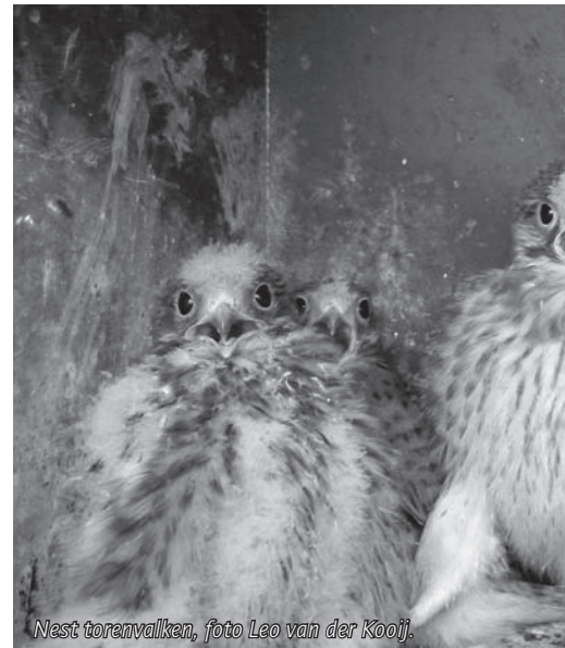
Nest torenvalken.