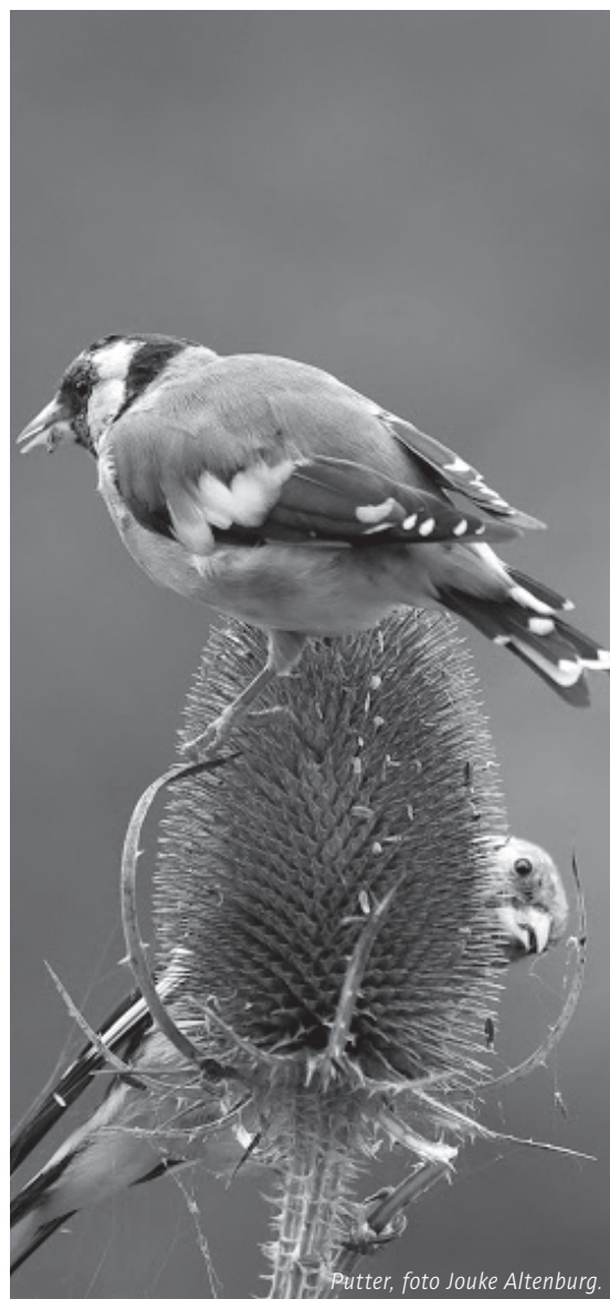
Putter, foto Jouke Altenburg.

Adres ketelvink: Middelcoopstraat 2a te Culemborg