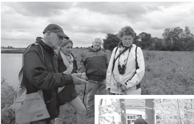
Lazarus- en Redichemse waard.