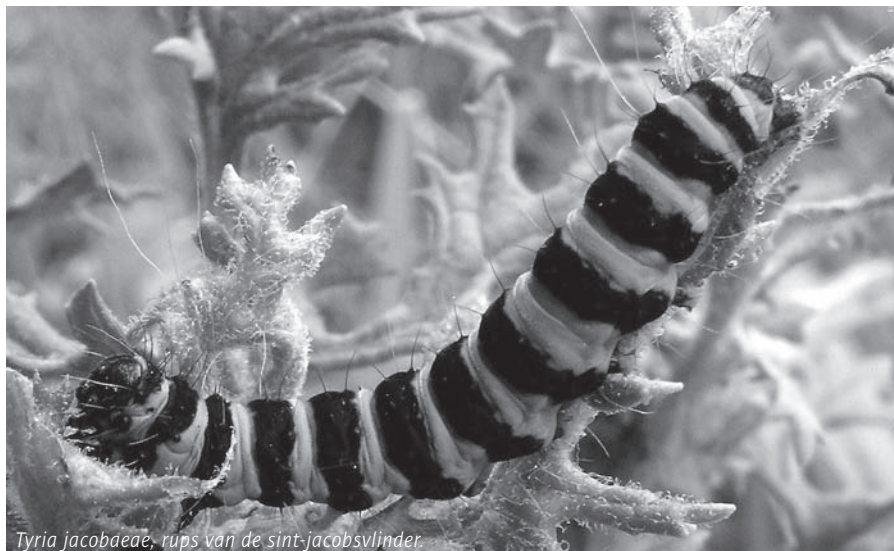
Tyria jacobaeae, rups van de sint-jacobsvlinder.