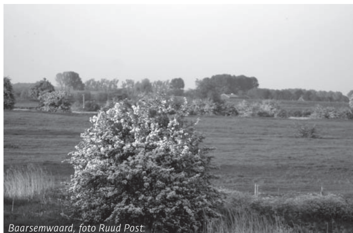
Baarsemwaard, foto Ruud Post.

De Natuur- en Vogelwacht Culemborg organiseert in vervolg op de winterwandeling van 11 februari een zomerwandeling. De wandeling in de winter was prachtig en adembenemend, maar stil. Tijdens de wandeling op 2 juni zal er geen stilte vallen. Zingende vogels, krassende sprinkhanen en fladderende vlinders trekken de aandacht. Het is geen lange wandeling en er zal veel stil gestaan en bekeken worden.