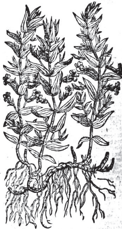
Een bladzijde uit Cruydt-Boeck 1644 over Gratiola.