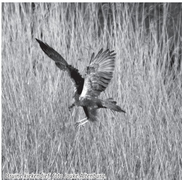
Bruine kiekendief.

Avondexcursie naar de Zouweboezem, tussen Ameide en Meerkerk