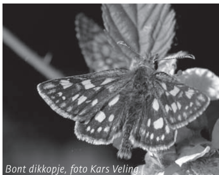
Bont dikkopje

gaat over de distelvlinder die in 2009 met miljoenen ons land binnen trok. Het geeft een beeld van de massaliteit en het wondere leven van deze trekvlinder.