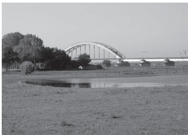
Steenwaard, foto Kars Veling.

Twee NVWC-leden hebben geparticipeerd in het inspraaktraject van het Waterschap Rivierenland voor de dijkverzwaring die nog moet plaatsvinden tussen Ravenswaaij en de Lange Dreef. Op de valreep van 2011 heeft de NVWC nog een zienswijze ingediend, omdat in de uiteindelijke plannen onvoldoende rekening gehouden wordt met de wettelijk zwaar beschermde kamsalamander en rugstreeppad.