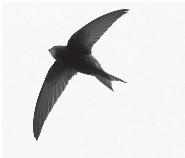
Gierzwaluw, foto's Jouke Altenburg.