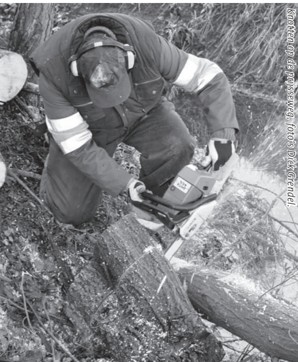
Knotten op de pijpseweg