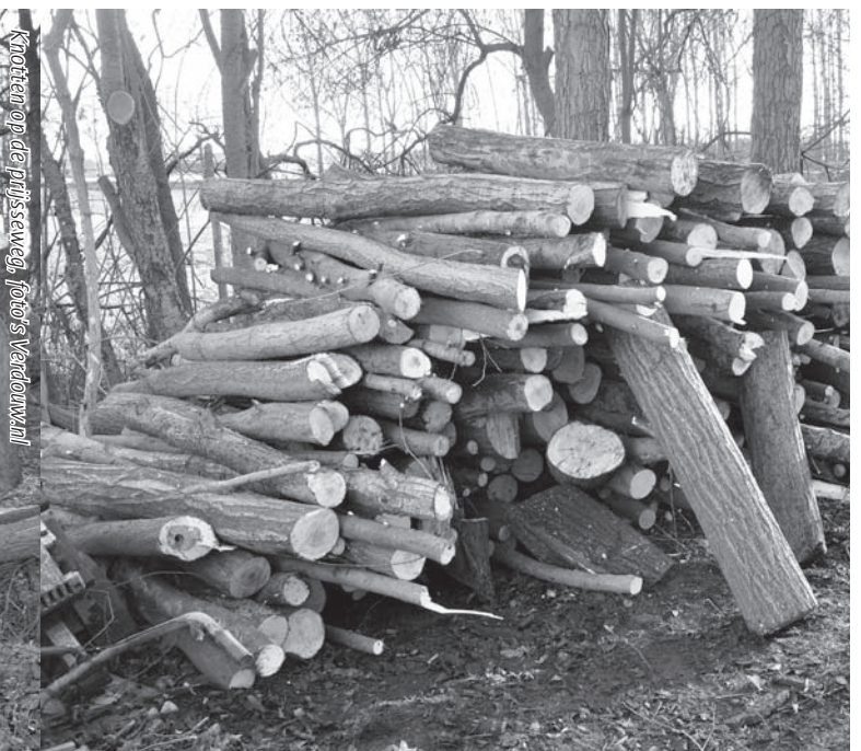
Knotten op de pijpseweg