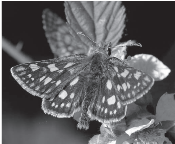
Bont dikkopje, foto Kars Veling.

naar de Kampina. Het was een mooie dag, met veel insecten, waaronder bosbeekjuffer en bont dikkopje. Met de excursie van 25 juni naar Fort Everdingen, samen met de plantenwerkgroep, troffen we miezerig weer. Met een klein groepje, ook weer met z'n achten, hebben we een wandeling rond Werk aan het Spoel gemaakt: een rijkdom aan planten en bloemen, maar nauwelijks insecten. Ook de derde excursie trok acht man: ondanks de slechte weersvoorspellingen waren er genoeg insecten te zien in het Tichelterrein. De Nationale Nachtvliedernacht op 2 september in het VITENS-terrein trok 25 mensen. Op deze zwoele avond werden 57 nachtvinders gedetermineerd, verdeeld over 22 soorten.