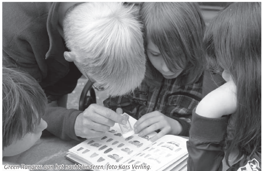
Green Rangers aan het nachtvlinders, foto Kars Verling.