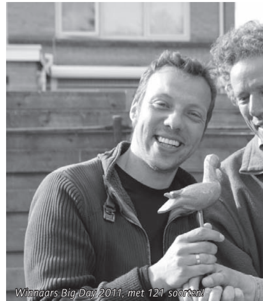
Winnaars Big Day 2011, met 121 soorten!