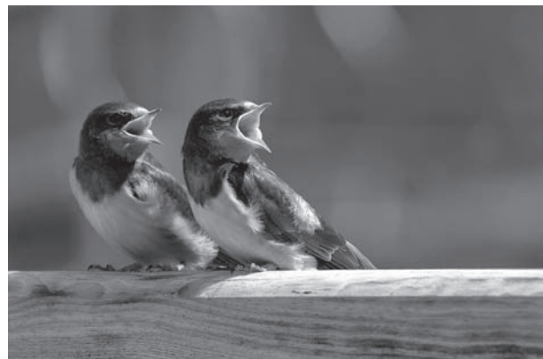
Boerenzwaluw, foto Jouke Altenburg.