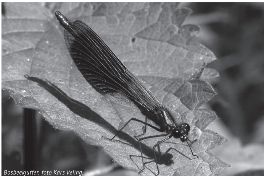
Bosbeekjuffer, foto Kars Veling.

laat aan de hand van ervaringen rond Culemborg zien hoe een aantal libellensoorten hun leefgebied heeft uitgebreid.