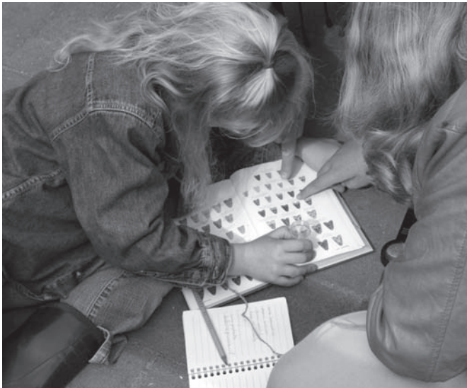
GreenRangers, nachtvlinders determinieren.

in mei een ochtend enthousiast meegelopen om de inhoud van een nachtvlinderval te determineren.