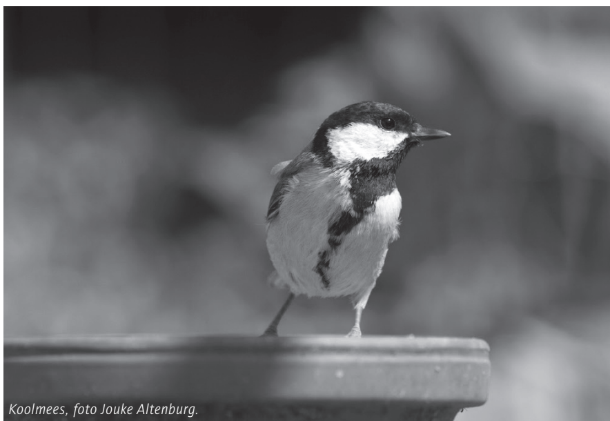
Koolmees