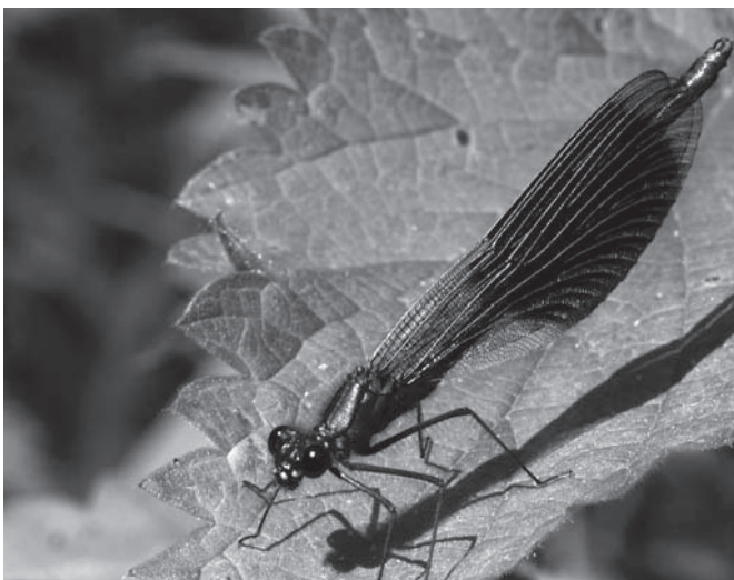
Bosbeekjuffer, foto Kars Veling.

De insectenwerkgroep organiseerde een drietal openbare excursies. Op 21 mei ging een groep van acht mensen