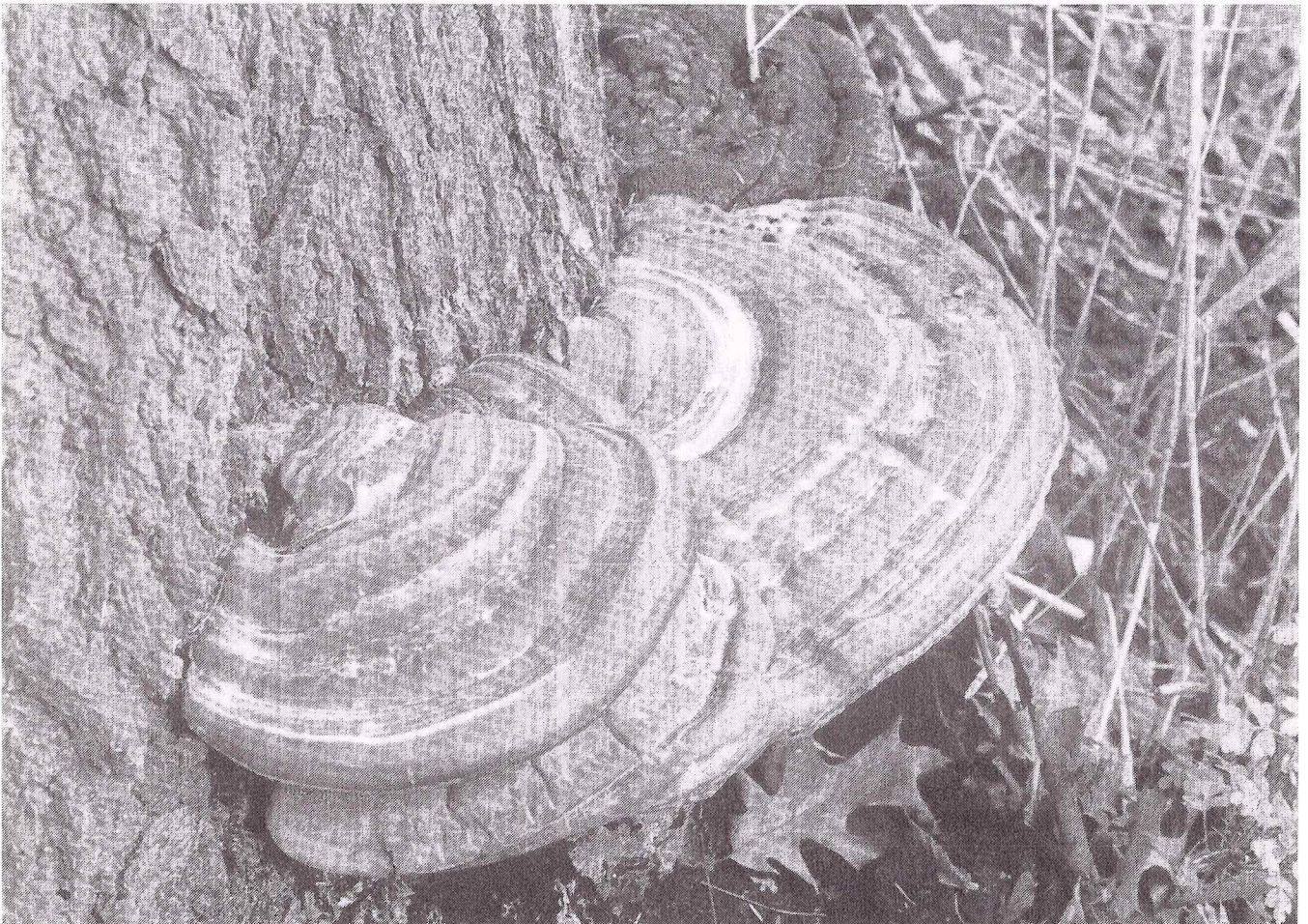
Deze Harslakzwam groeit op een der Amerikaanse eiken aan de zuidrand van het Landgoed Soelen. Deze zwam was tot voor kort zeer zeldzaam, maar breidt zich nu gestadig uit.