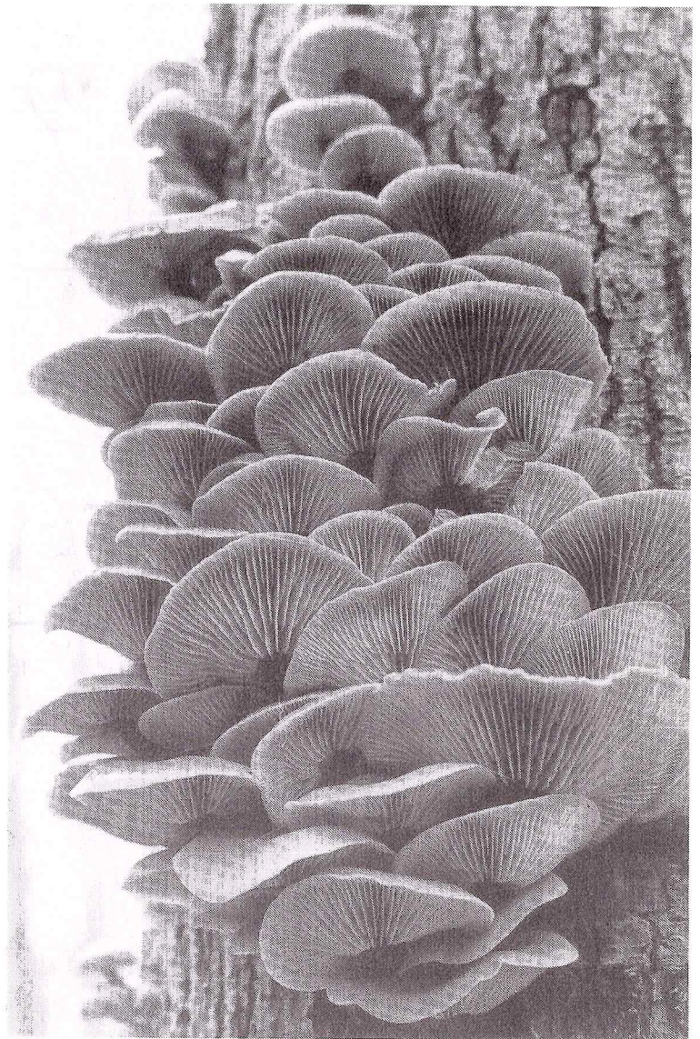
Het Fluweelpootje is een paddestoel die ook bij licht vriezend weer door kan blijven groeien.

De lange beukenlaan is wat vogels betreft in het voorjaar het domein van de Fluiter . Maar ook in de herfst zijn hier blijkbaar leuke vogelwaarnemingen te