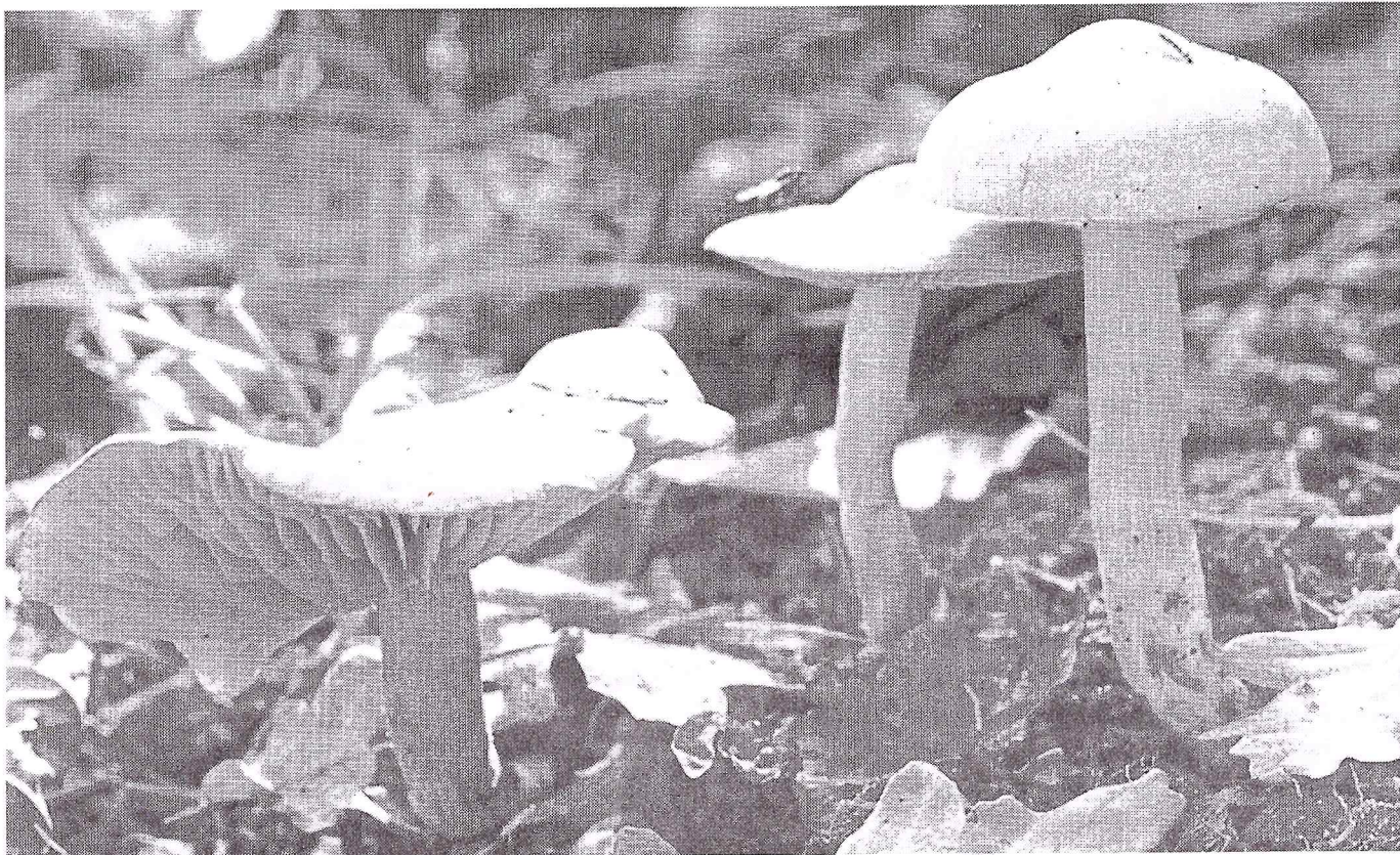
Narcisridderzwam ( Tricholoma sulphureum ) groeit plaatselijk talrijk in de Plantage.

di 23 okt. Het begint alweer een traditie te worden om in deze tijd en petit comité materiaal te verzamelen in de Kaapse Bossen voor de paddestoelenavond in de Ketelvink. Ook dit jaar werd daarbij weer een nieuwigheid gevonden: Spieringtrechterzwam ( Clitocybe phaeophthalma ). Het vorig jaar al gesignaleerde Plooiwieswaaiertje ( Plicaturopsis crispa ) werd ook nu weer gevonden.