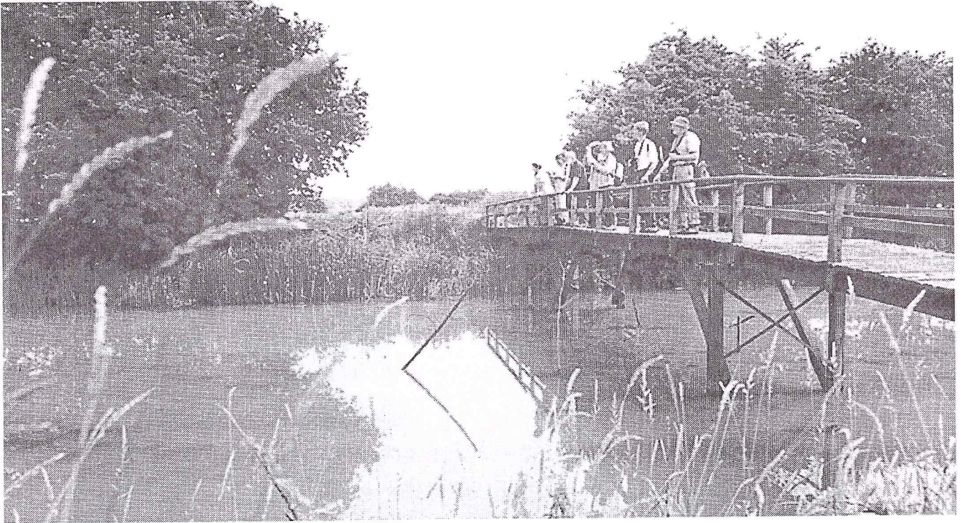
Amerongse Bovenpolder, 30 juni 2001. De gemarkeerde wandeling gaat via een houten brug over een oude rivierstrang.

Wat betreft de opmars van de Grote waternavel ( Hydrocotyle ranunculoides ), JanDirk Buizer wees ons op enkele nieuwe groeiplaatsen. Tijdens libelleninventarisaties trof hij deze nieuwkomer aan o.a bij de Ronde Haven en bij de Kasteeltuin .