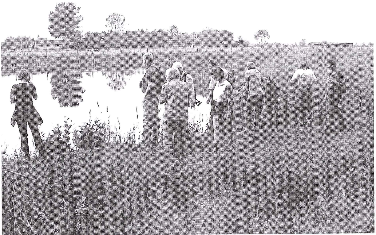
Excursie van de libellencursus in het Tichelterrein in Buren.

De insectenwerkgroep heeft in 2001 twee excursies of 'insectenwandelingen' georganiseerd. Dit jaar hield het weer zich beide keren goed genoeg. In de Baarsemwaard is in juli met zo'n twintig mensen naar de effecten van de nieuwe natuur op insecten gekeken. In september is een groep excursiegangers mooie en zeldzame libellen gaan bekijken in de Plateaux.