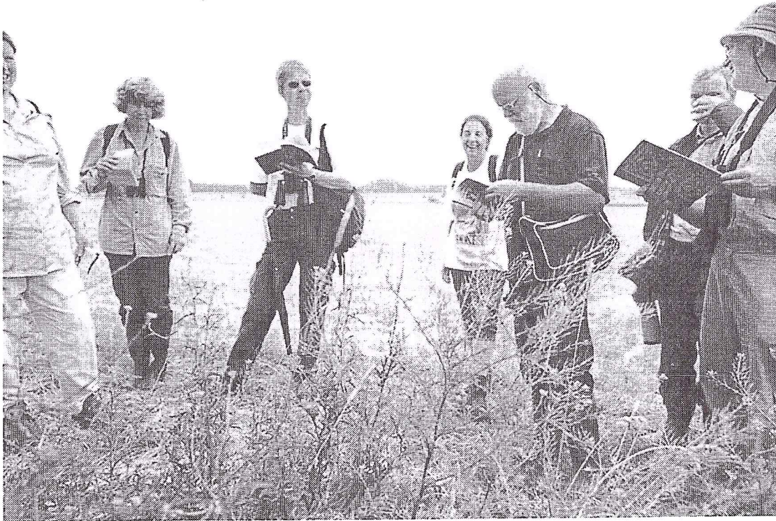
De Plantenwerkgroep bij het determineren van Sofikruid, Amerongse Bovenpolder 30 juni 2001

Al spoedig vonden we de eerste lokale bijzonderheid: Beemdkroon ( Knautia arvensis ) een vrij zeldzame plant van kalkrijke en goed gedraineerde weilanden en dijkellingen. Helaas komt deze soort bij Culemborg niet voor. Eveneens bijzonder was een stukje zomerdijk met tientallen exemplaren van de zeldzame Ruige leeuwentand ( Leontodon hispidus ). Langs de rivier troffen we nog enkele planten van Sofikruid ( Descurainia sophia ) aan en op een zonnig stukje op de Bandijk vonden we Muizenoor en Kleine leeuwentand . Herhaling aanbevolen!