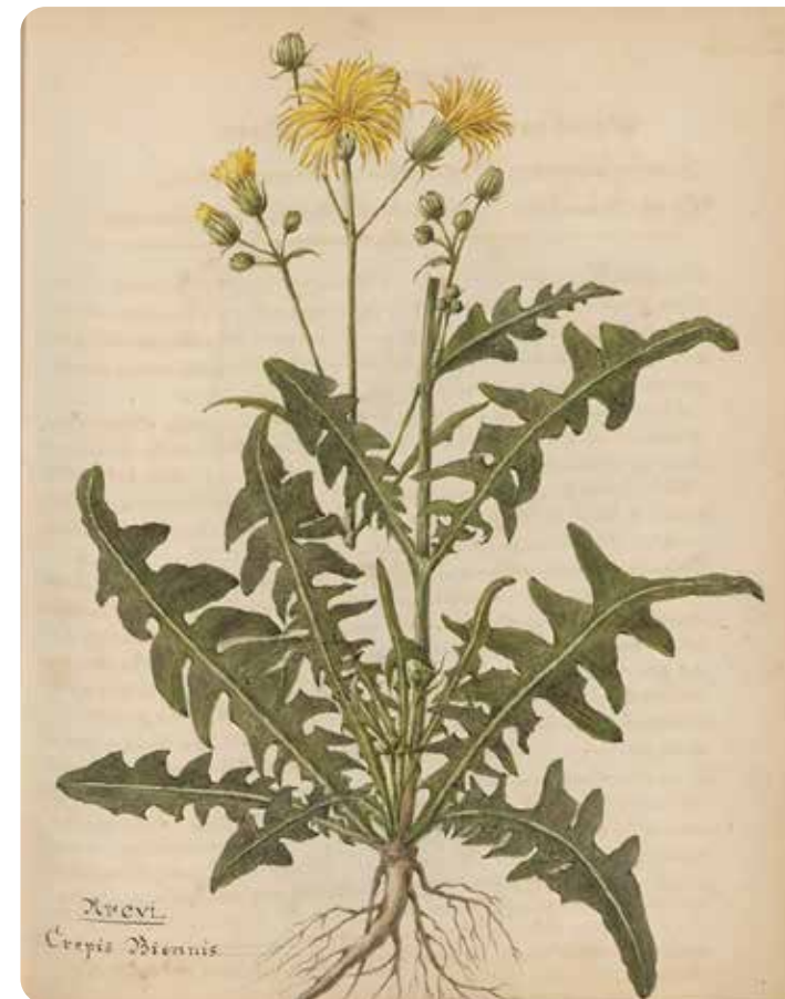
Groot streepzaad, moeraskartelblad Muurvaren, waterviolier.

Het wordt tijd om weer op huis aan te gaan voor het middagmaal. Hij keert weer om en loopt de Goilberdingerstraat in, maakt nog