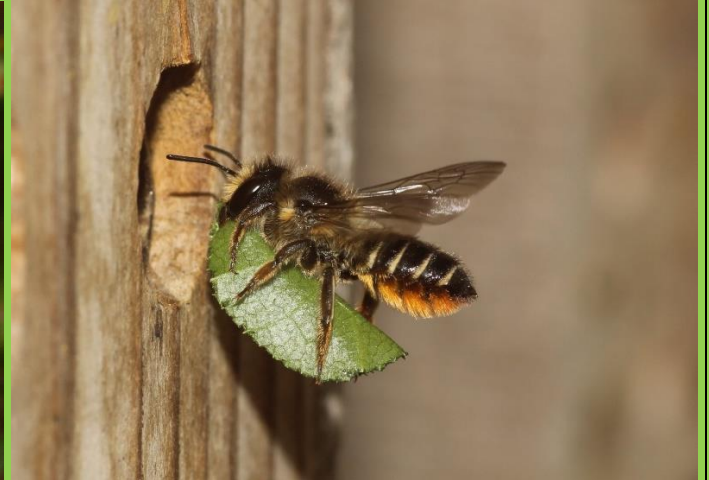
Tuinbladsnijder voor haar nestgang