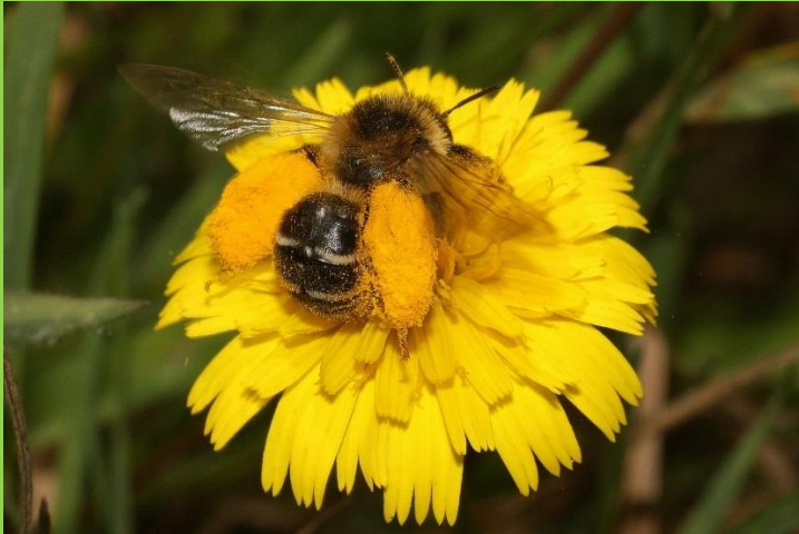
Pluimvoetbij beladen met stuifmeel