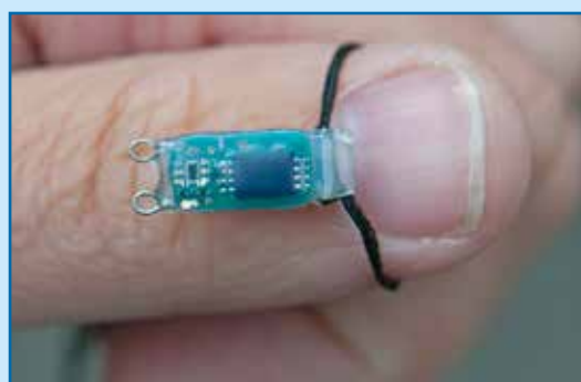
Een geolocator (model 2012) gepresenteerd op een duim. 3-8-2012

Na het uitlezen van de geheugenchip kunnen, op basis van de datum-tijd-lichtinformatie, de tijdstippen 'zon op' en 'zon onder' worden bepaald. Daaruit kan vervolgens de breedtegraad worden afgeleid. De lengtegraad wordt afgeleid uit de hoogte van de zon om 12:00 uur. Door die twee gegevens te combineren kan de dagelijkse positie van een vogel worden berekend. De foutenmarge van een geolocator ligt rond de 150 km. Maar dat is op een schaal van Nederland naar Zuid-Afrika nog redelijk nauwkeurig.