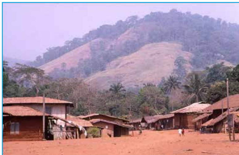
Uitzicht vanuit het dorpje Ebakken (Nigeria) op de hellingen met olifantsgras, waar de overwinterende boerenzwaluwen overnachten. 2002.