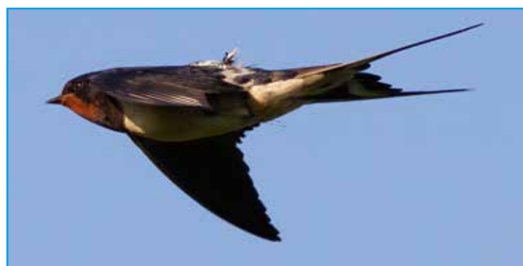
Vliegende boerenzwaluwman met geolocator, model 2011. De lichtsensor (staafje) steekt boven de rugveren uit. Culemborg, 4-7-2011