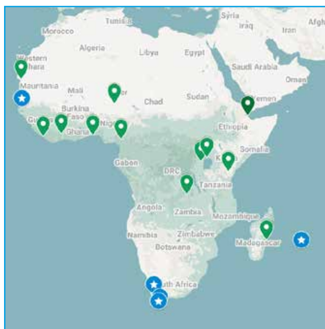
Figuur 1: Locaties op het Afrikaanse continent waar systematisch ringonderzoek wordt uitgevoerd [8].

Maar de resultaten van ringonderzoek zijn sterk afhankelijk van de vind- en meldkans. Locaties waar systematisch vogels worden gevangen spelen daarbij een belangrijke rol. In tegenstelling tot West-Europa zijn dat er in Afrika niet zoveel (figuur 1). Daar komt