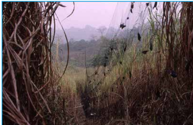
De Nigeriaanse dorpelingen hadden met machetes baantjes in het olifantsgras gemaakt, zodat de mistnetten opgesteld konden worden. Ebakken, 2002