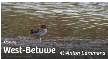
Afdeling West-Betuwe © Anton Lemmens