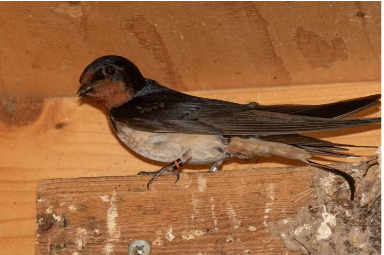
2-7-2022: Man NON/a met voer in de snavel bij zijn nest met succesvol uitgevlogen jongen, in het jaar vóór-dat hij met NGN/a gepaard raakte.

is een nestsucces van 16%. Gemiddeld bedraagt deze waarde voor boerenzwaluwen 75-80% [7]. Een broedsucces van in totaal zeven uitgevlogen jongen in vier broedseizoenen kunnen we met recht kwalificeren als een Betuwse tragedie. In een 'normaal' scenario hadden dat 35 of meer uitgevlogen jongen kunnen zijn (figuur 2).