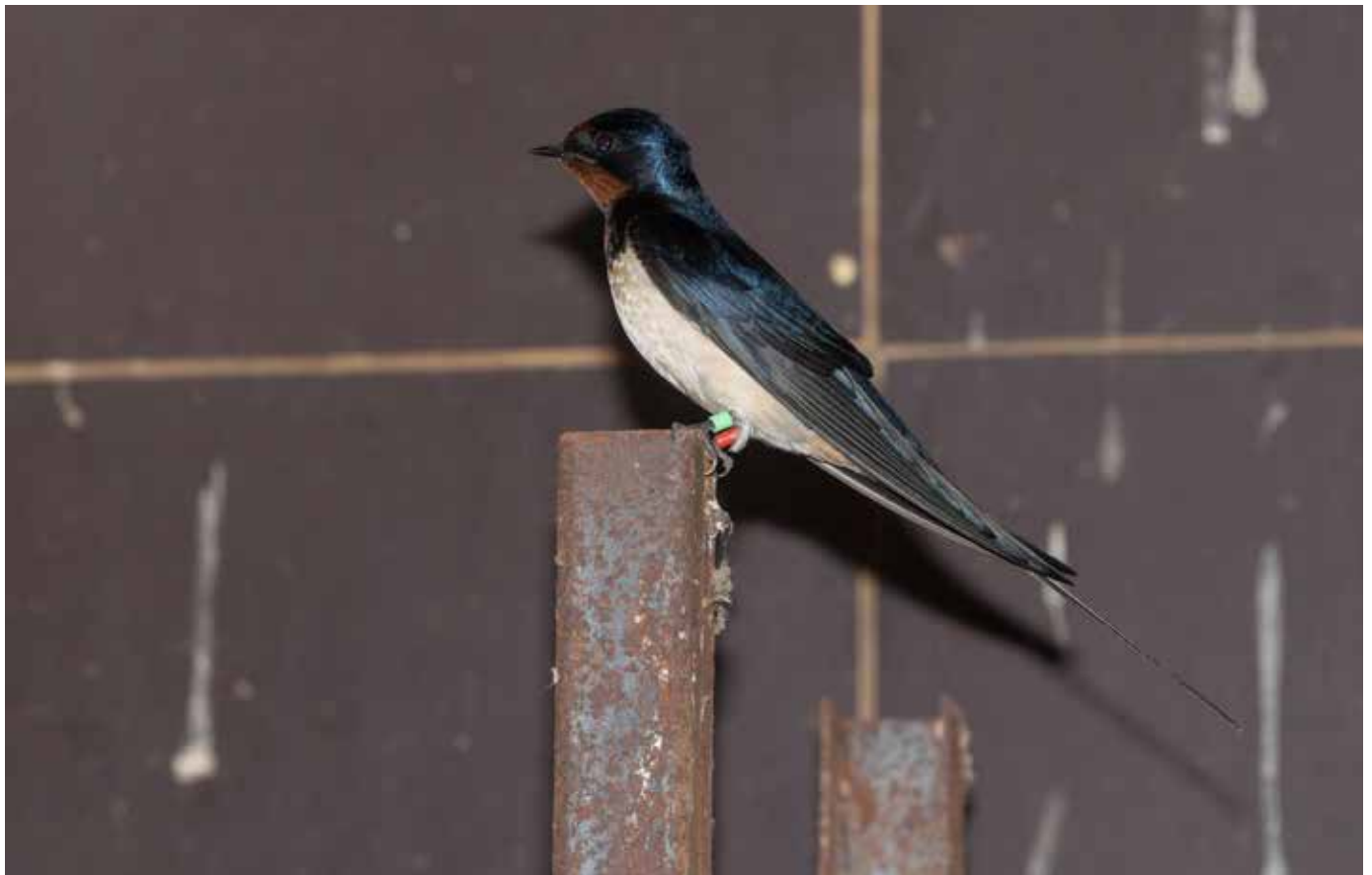
18-4-2026: Man felgroen felgroen met een rood geverfde metalen ring (fGfG/rood a) was de partner met wie NGN/a in 2025 uiteindelijk nog drie jongen groot kreeg.